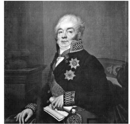
Граф Дмитрий Александрович Гурьев